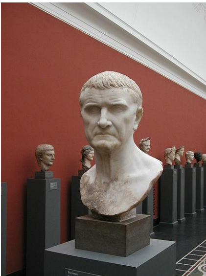
Porträtkopf, wahrscheinlich Marcus Licinius Crassus, Kopenhagen, Ny Carlsberg Glyptotek

Arbejdstid: 40 minutter, incl. afsendelse af dokument med listen til ope@vuf.nu