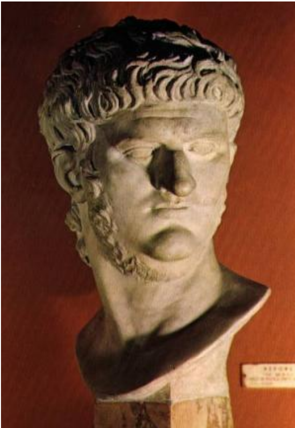
Kejser Nero - Capitolmuseét