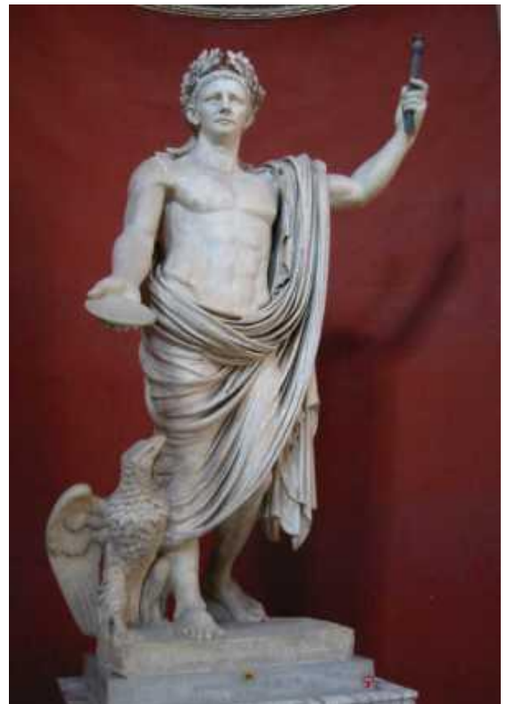
Kejser Claudius - Vatikanmuseet