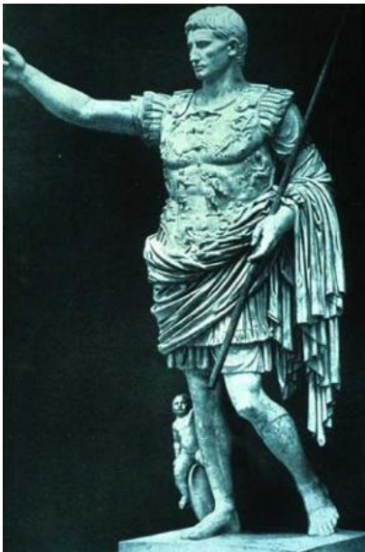
Kejser Augustus - Vatikanmuseet