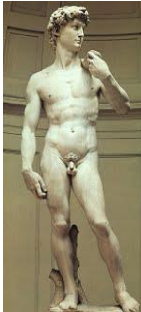
David af Michelangelo