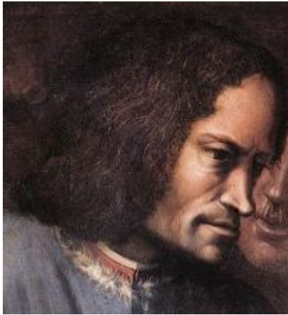
Lorenzo de' Medici