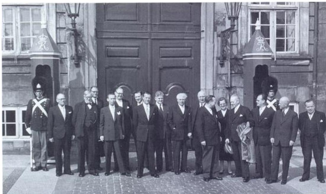
Trekantregeringens ministre efter præsentationen for kongen den 28. maj 1957. Fra venstre Søren Olesen, Oluf Pedersen, Kjeld Philip, Kaj Bundvad, Kai Lindberg, Poul Hansen, J. O. Krag, Karl Skytte, Julius Bomholt, Jørgen Jørgensen, H. C. Hansen, Bodil Koch, Bertel Dahlgaard, Viggo Kampmann, Viggo Starcke og Hans Hækkerup

Men i forsommeren 1957 måtte regeringen starte med at gennemføre den finanspolitiske stramning, som havde været prøvestenen på Retsforbundets vilje til at påtage sig regeringsansvar, da man forhandlede om regeringsdannelsen. Der var ingen nytænkning i lovbuketten, men alene den allerede indøvede måde at rette op på valutabalancen på, afgiftsforhøjelser og bunden opsparring. Regeringen havde imidlertid denne gang også en mere langsigtet plan, der sigtede mod at fremme investeringerne. For det første opgav man den tidligere tilbageholdenhed med at optage lån i udlandet. Allerede i juni 1957 opnåede Danmark et lån på 34 mio. dollars (svarende til 238 mio. kr.), så der ikke umiddelbart skulle være nogen risiko for, at valutamangel igen skulle bremse et økonomisk opsving. For det andet blev et forslag fra før valget taget op igen og gennemført. Det drejede sig om en betydelig omlægning af erhvervslivets afskrivningsregler og om dets mulighed for skattefrie henlæggelser til investeringsfonde. Disse forslag kom egentlig fra et udvalg, der havde arbejdet med spørgsmålet siden Thorkil Kristensens ministertid.